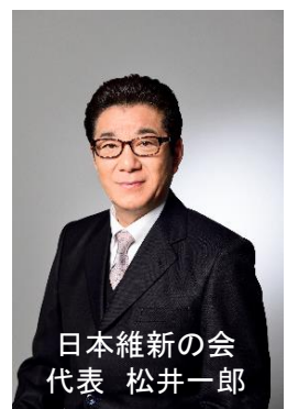
日本維新の会 代表 松井一郎