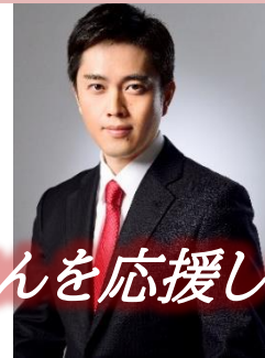
日本維新の会 共同代表 吉村 洋文