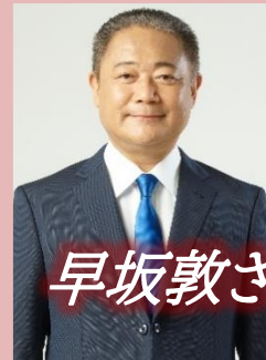
日本維新の会 代表 馬場 伸幸